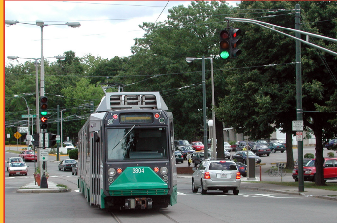
交通信号灯优先项目指南

波士顿地区 MPO 期待构建一个能得到良好维护的现代化交通系统，以支持地区的可持续、健康、宜居和繁荣发展。为了实现这一愿景，交通系统必须兼具安全性和灵活性；结合新兴技术；并提供合理的通道、出色的流动性和多种交通选择。