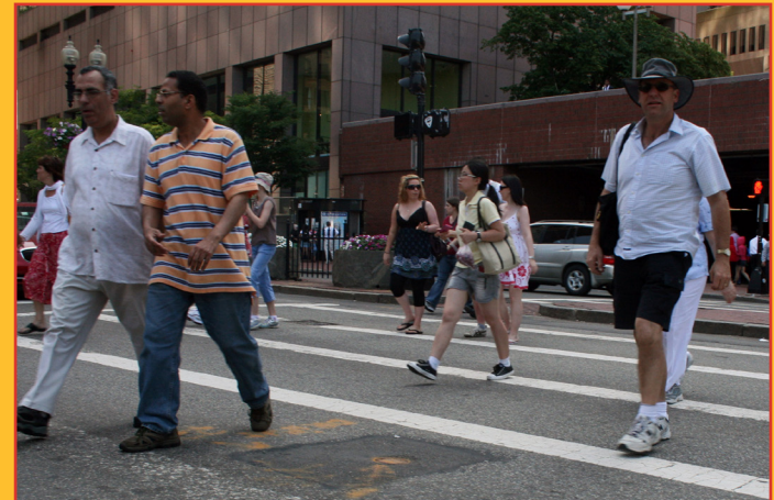
Base de datos interactiva de evaluación de la tarjeta de reporte de los peatones

Los estudios previos están disponibles en nuestro Archivo de publicaciones .