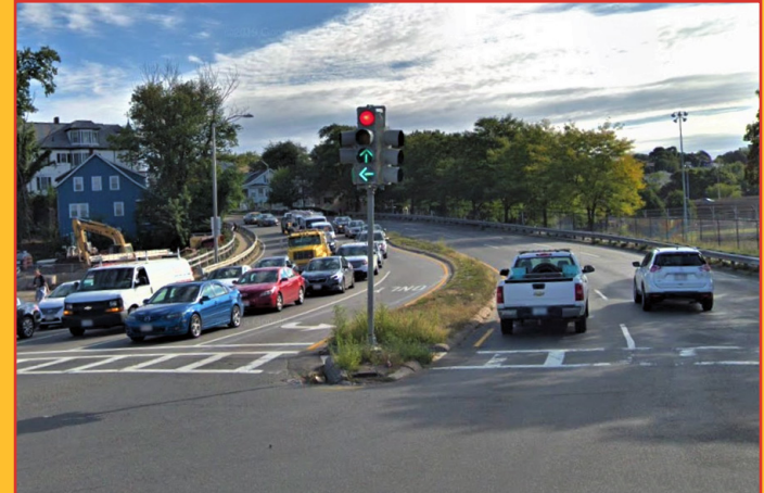
Estudio del corredor prioritario de la ruta 16, Chelsea y Everett, Massachusetts