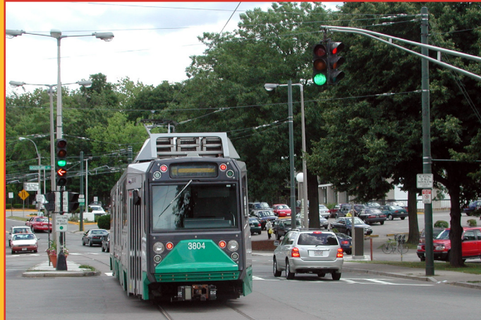
Guía de prioridades en materia de señales de tránsito

La MPO de la región de Boston prevé un sistema de transporte moderno, bien mantenido, que apoye una región sostenible, saludable, habitable y económicamente vibrante. Para alcanzar esta visión, el sistema de transporte debe ser seguro y resiliente, incorporar las tecnologías emergentes y proporcionar acceso equitativo, excelente movilidad y opciones de transporte diversas.