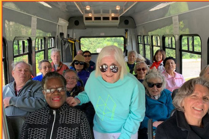
Guía de operación de un programa de transbordador comunitario exitoso